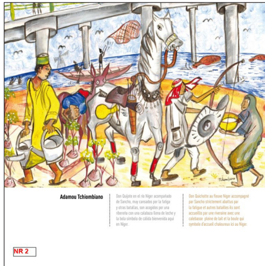
FIGURA 5. Adamou Tchiombiano. 2016. Don Quijote regando las plantas cerca del río Níger.

que resuenan con las preocupaciones medioambientales y ecológicas contemporáneas. Podemos postular que los ilustradores y Cervantes parecen compartir una visión humanista de la naturaleza, en la que el ser humano es parte integrante de un entorno que debe ser valorado y protegido. Mientras que en el Quijote Cervantes muestra la naturaleza en su estado original, en contraste con la que ha sido alterada por la mano del hombre, los artistas son más realistas. La representan tal y como la ve la comunidad, en su estado caótico y alarmante.