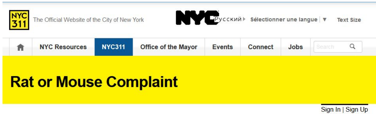
Fig. 1 – Structuration du récit dans le formulaire 4

Cette structuration renvoie à l'action et au cadre spatio-temporel d'un récit ainsi qu'au personnage. Nous retrouvons les éléments du plan majeur du schème interactif de Bertrand Gervais (1990), schème qui est actualisé dans toute représentation discursive d'une action :