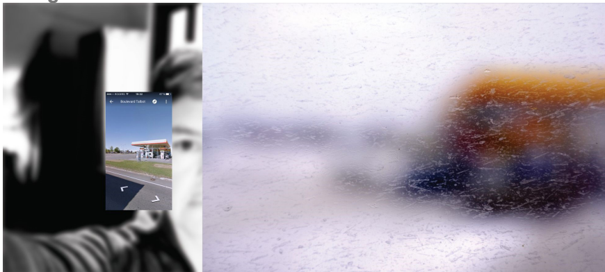
Je suis dans l'autocar, I. Chicoutimi–Québec (capture d'écran 4).

Foucault définit l'expérience du miroir comme un intermédiaire entre utopie et hétérotopie :