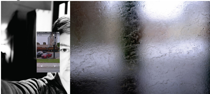
Je suis dans l'autocar, I. Chicoutimi–Québec (capture d'écran 5).