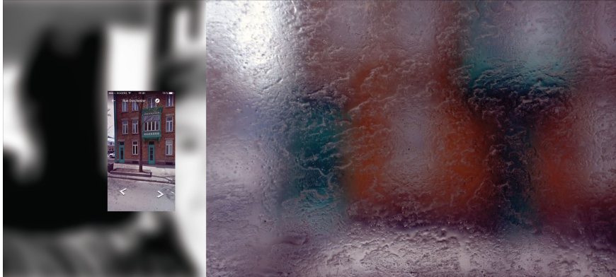
Je suis dans l'autocar, I. Chicoutimi–Québec (capture d'écran 3).

Nous composons au quotidien avec cette fragmentation des perceptions, inhérente à l'hybridation de nos expériences sensibles. Je suis dans l'autocar révèle l'absurdité et la poésie de notre condition d'humain connecté. Les technologies numériques modifient notre appréhension du réel, ici de l'espace. Mais qu'est-ce qui est le plus réel ? ce qui s'affiche sur notre iPhone ? ce que nous voyons par la vitre ? l'image que nous demandons au capteur de notre appareil photo numérique pour attraper et rendre compte de ce que nous voyons ? de ce que nous ressentons ? Est-ce que l'image de la vitre sale aurait le même impact émotionnel si elle n'était confrontée à l'image si propre de Google Street View ? Par contraste, les technologies numériques nous amènent à porter une attention particulière à la matérialité imparfaite que nos sens peuvent saisir et à la chérir.