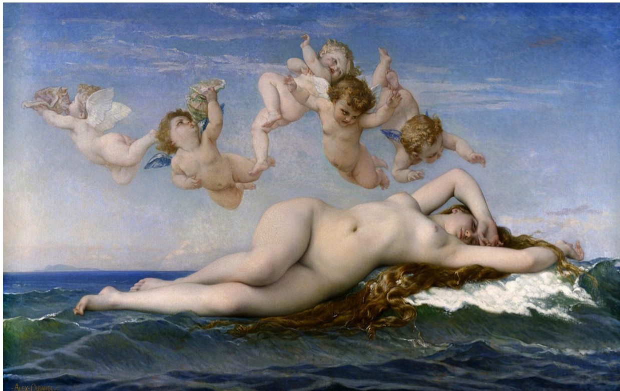
La naissance de Vénus , Alexandre Cabanel, 1863, huile sur toile, 130 x 225 cm