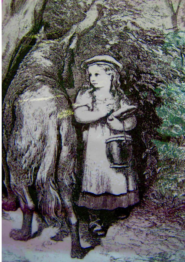
Illustration de Gustave Doré pour le recueil Contes de Charles Perrault