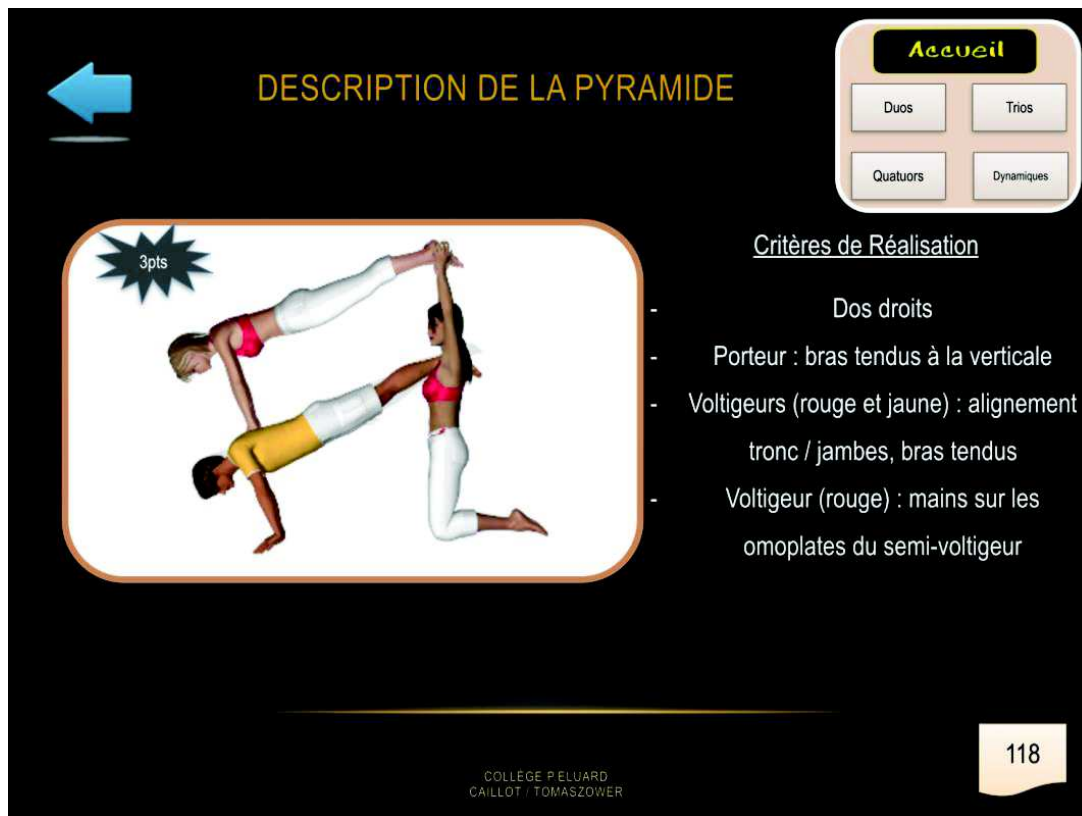
Figure 5 : Exemple de figure présente dans le répertoire des trios statiques à 3 points.

Pour chaque figure, l'enseignant a explicité les critères de réalisation de façon à permettre aux élèves de comprendre en détail comment sont réalisées ces figures. Les critères de réalisation insistent sur le placement des porteurs et des voltigeurs et également sur les formes de corps à adopter.