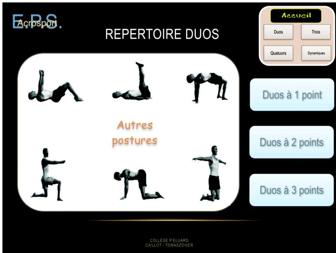
Figure 2 : Page d'accueil du répertoire de duos statiques.

Les figures sont répertoriées par difficulté par un système de point allant de 1 à 3 points. Du plus simple au plus difficile.