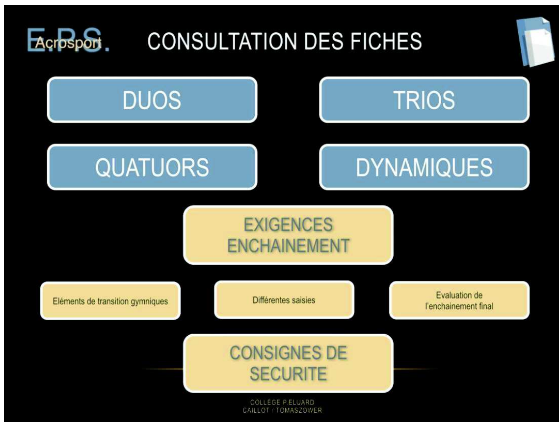
Figure 1 : Page d'accueil du diaporama interactif.