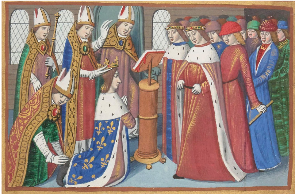
Sacre du roi Charles VII à Notre-Dame de Reims. Miniature issue du manuscrit de Martial d'Auvergne, Les Vigiles de Charles VII , vers 1484.

b) Le sacre du dauphin Charles VII à Reims le 17 juillet 1429 selon les Vigiles de Charles VII