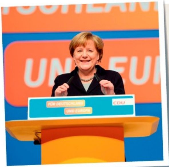
Angela Merkel, Dezember 2014