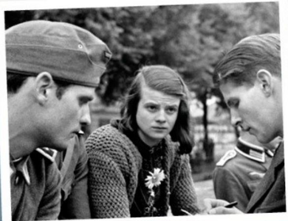
Sophie Scholl, 1942

1. jdn verraten: tahir qqn 2. jdn hin/richten: exécuter qqn