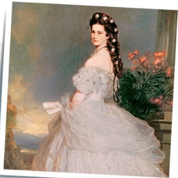
Franz Xaver Winterhalter, Kaiserin Elisabeth von Österreich , 1865

Elisabeth (als Sissi bekannt) wurde 1837 als Tochter des Herzogs Maximilian von Bayern in München geboren. 1854 heiratete sie Franz Josef von Österreich und wurde so Kaiserin von Österreich. Trotz ihrer außergewöhnlichen Schönheit und einer märchenhaften Karriere als Kaiserin von Österreich und Königin von Ungarn war sie zeit ihres Lebens unglücklich. Sie litt besonders unter dem strengen Protokoll des Wiener Hofes.